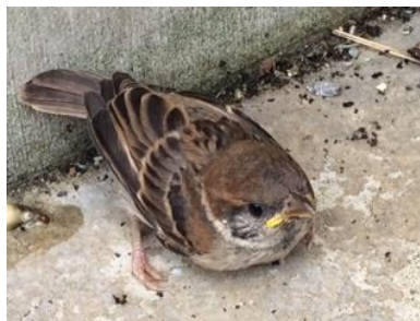
昨年6月に生まれた子スズメ